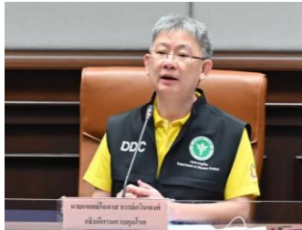
นพ.โอภาส การย์กวินพงศ์ ปลัดกระทรวงสาธารณสุข