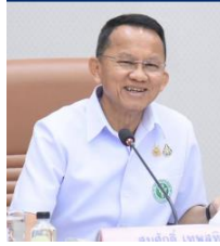
นายสมศักดิ์ เทพสุทิน รัฐมนตรีว่าการกระทรวงสาธารณสุข

สำนักงานสาธารณสุขอำเภอแม่ทะ จังหวัดลำปาง (หน่วยงานภายใต้กระทรวงสาธารณสุข)